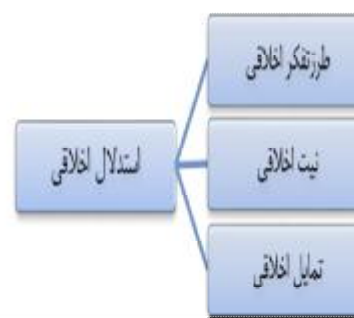
نگاره 1: مدل مفهومی پژوهش

هدف از این مطالعه، بررسی رابطه بین استدلال اخلاقی و طرز تفکر، نیت و تمایل اخلاقی حسابداران رسمی می‌باشد. در این مطالعه، استدلال اخلاقی به عنوان متغیر وابسته و طرز تفکر اخلاقی، نیت اخلاقی و تمایل اخلاقی به عنوان متغیرهای مستقل در نظر گرفته شدند که برای سنجش آنها به ترتیب از آزمون قضاوت اخلاقی و مقیاس اخلاقیات چندبعدی استفاده شد. با توجه به بررسی ادبیات تحقیق و پژوهش‌های گذشته مدل اولیه پژوهش جهت معرفی ارتباط بین متغیرهای پژوهش طراحی شد.