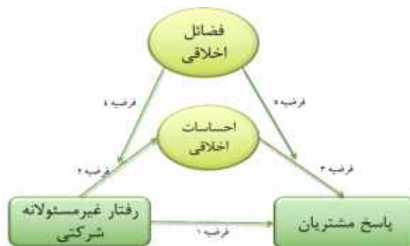
نگاره ۱. مدل مفهومی پژوهش

همچنین نقش میانجی احساسات اخلاقی در رابطه بین رفتار غیر مسئولانه شرکتی و پاسخ مشتریان می‌باشد. در نگاره ۱ مدل مفهومی پژوهش ارائه شده است.