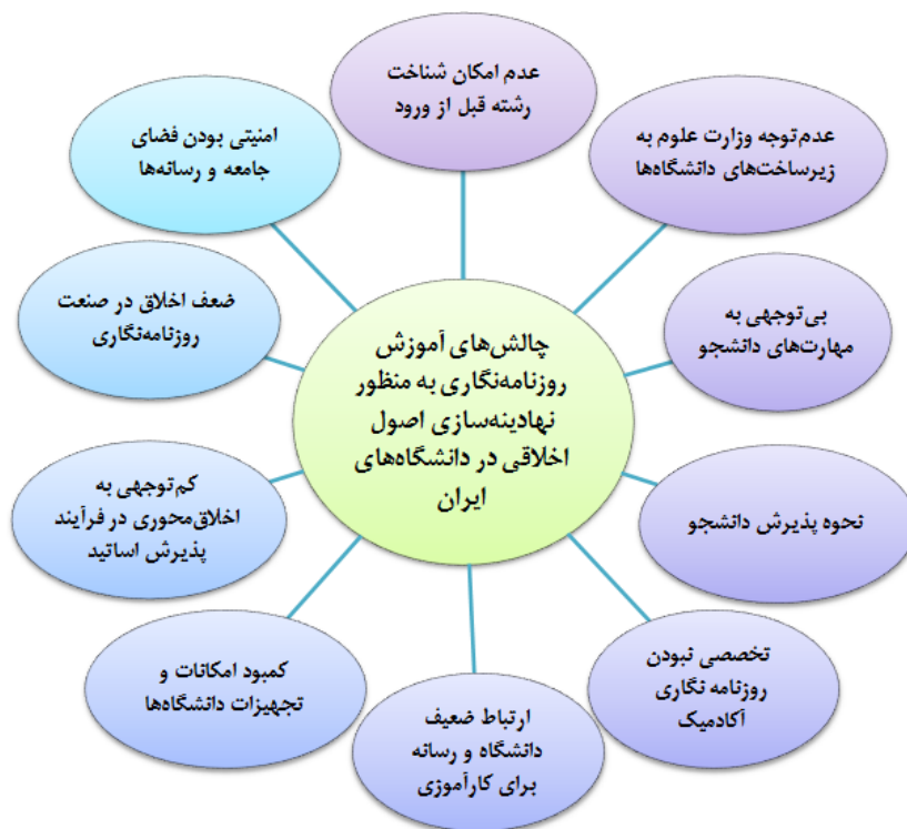
نگاره ۱: مدل پیشنهادی پژوهش