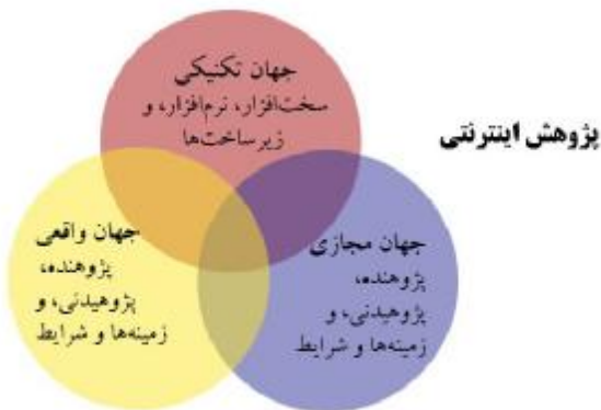
نگاره 2. اثر متقابل جهان‌های واقعی، مجازی و تکنیکی در پژوهش‌های اینترنتی (7)

روش‌های کمی و کیفی متنوعی در فضای مجازی هدایت می‌گردد. با فرض این تنوع در روش، به نظر می‌رسد در رابطه با هر پژوهش و تحقیقی، ارتباط میان این جهان‌های سه‌گانه می‌تواند در زمینه‌های فرهنگی و اجتماعی منحصر به فرد خود، به نحو متفاوت و متمایزی تحقق یابد. از این رو، استلزام‌های اخلاقی در فرآیند چنین پژوهش‌هایی باید در زمینه‌ها و شرایطی منحصر به فرد و موقعیت‌های خاص هر یک از این پژوهش‌ها و تحت تأثیر مناسبات و اقتضائات این سه جهان بررسی شود. در نتیجه، در پژوهش‌های اینترنتی، ابزار و محیط انجام پژوهش، موقعیت پژوهندگان و سوژه‌های انسانی، روابط میان آنان و نوع گردآوری داده‌ها ممکن است به طور کامل متفاوت و متمایز باشد (7). آنچنان که نگاره 2 نشان می‌دهد، در تعامل این جهان‌های سه‌گانه اگر پژوهش‌های اینترنتی از منظر تداخل میان جهان واقعی و جهان تکنیکی ملاحظه شود «اینترنت به مثابه ابزار پژوهش 14 » مورد استفاده قرار می‌گیرد و اگر از منظر تداخل میان جهان واقعی و جهان مجازی بررسی گردد «اینترنت به مثابه محیط پژوهش 15 » در نظر گرفته می‌شود.