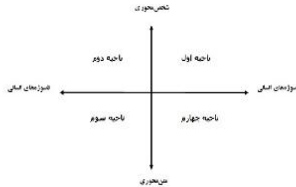
نگاره 4. موقعیت‌یابی سوژه‌های انسانی با تمرکز بر آسیب‌پذیری آنان

2) ناحیه دوم دربردارنده ناسوژه‌های انسانی شخص محور است؛ به عنوان مثال سوژه‌های پژوهشی، آواتارهای اشخاص هستند. آسیب‌پذیری سوژه‌های مورد پژوهش این ناحیه در مقایسه با ناحیه اول از درجه مخاطرات اخلاقی کمتری برخوردار است. 3) ناحیه سوم شامل ناسوژه‌های انسانی متن محور است؛ مثلاً می‌توان محتوای وبلاگ‌ها را سوژه پژوهشی خود قرار داد. به نظر می‌رسد در این ناحیه نیز آسیب‌پذیری سوژه‌های مورد پژوهش در مقایسه با دو ناحیه پیشین از درجه مخاطرات اخلاقی کمتری برخوردار است. 4) ناحیه چهارم دربردارنده سوژه‌های انسانی متن محور است؛ نمونه‌ای از این سوژه‌های پژوهشی، پروفایل افراد در شبکه‌های اجتماعی است. اما در این ناحیه به نظر می‌رسد به‌خاطر دستیابی و شناسایی ساده‌تر سوژه‌های انسانی از درجه مخاطرات اخلاقی بیشتری در مقایسه با ناحیه‌های دوم و سوم برخوردار است.