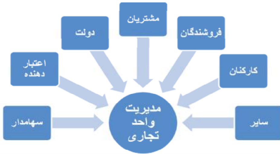
نگاره 1. واحد تجاری به‌عنوان مجموعه‌ای از قراردادها