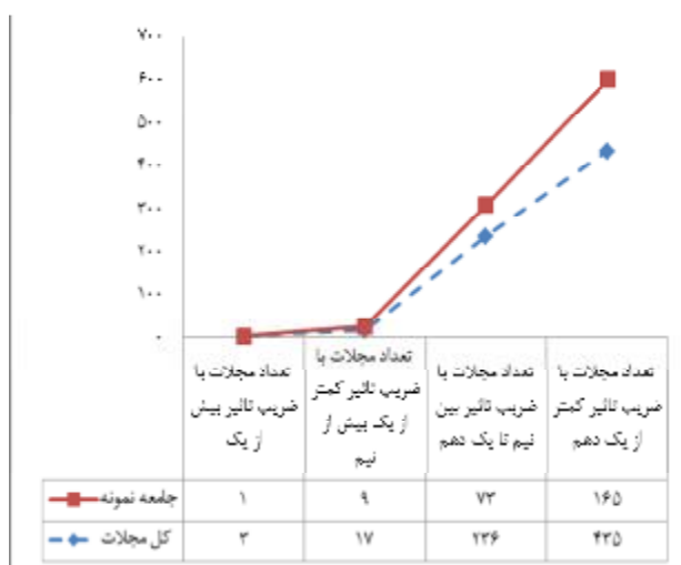
نگاره 1: وضعیت ضریب تأثیر کل نشریات (691 عنوان) و جامعه نمونه (248 عنوان)

بررسی وضعیت ضریب تأثیر نشریات نشان داد که بیش از نیمی از آنها ضریب تأثیر کمتر از 0/1 دارند. با توجه به تصادفی بودن انتخاب نشریات، ضریب تأثیر نشریات جامعه نمونه نیز همچون کل نشریات دارای ضریب تأثیر، به طور کلی کمتر از 0/1 است. نگاره 1 این وضعیت را به خوبی نشان داده است.