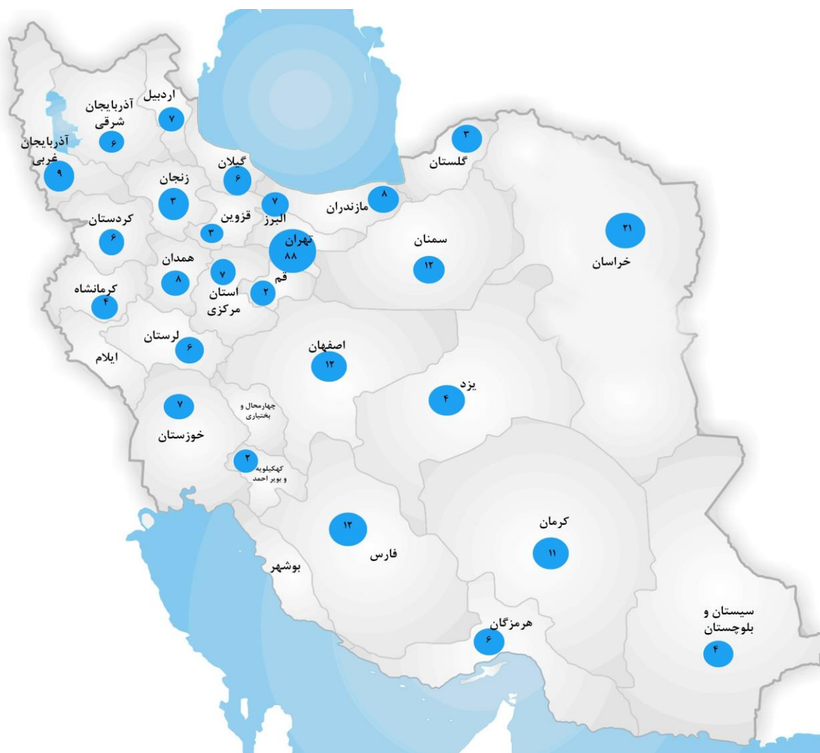
نگاره ۱. مقایسه استان‌های کشور بر اساس مقالات ارسالی به فصلنامه اخلاق در علوم و فناوری در سال ۱۳۹۷

بالاترین تعداد مقالات دریافتی به ترتیب از دانشگاه‌های استان های؛ تهران، خراسان، فارس، اصفهان و سمنان بوده‌اند (نگاره ۱). همچنین، در نگاره شماره ۲ تعداد انواع مقالات پذیرش شده در سال ۱۳۹۷ به نمایش درآمده است که نشان می‌دهد بیشترین میزان مقالات پذیرفته شده به ترتیب شامل؛ مقالات پژوهشی، مروری، مقالات کوتاه و نامه به سردبیر بوده است.